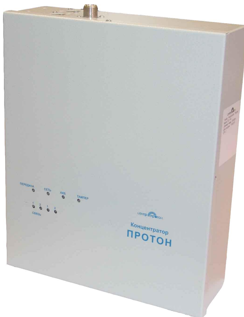
Рисунок 1 – Внешний вид концентратора.

На боковой поверхности корпуса концентратора размещена клемма для подключения заземления.